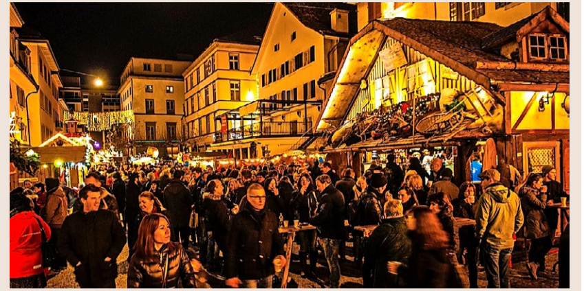
Bilder wie dieses bleiben dieses Jahr aus: Der Winterthurer Weihnachtsmarkt 2020 ist offiziell abgesagt.