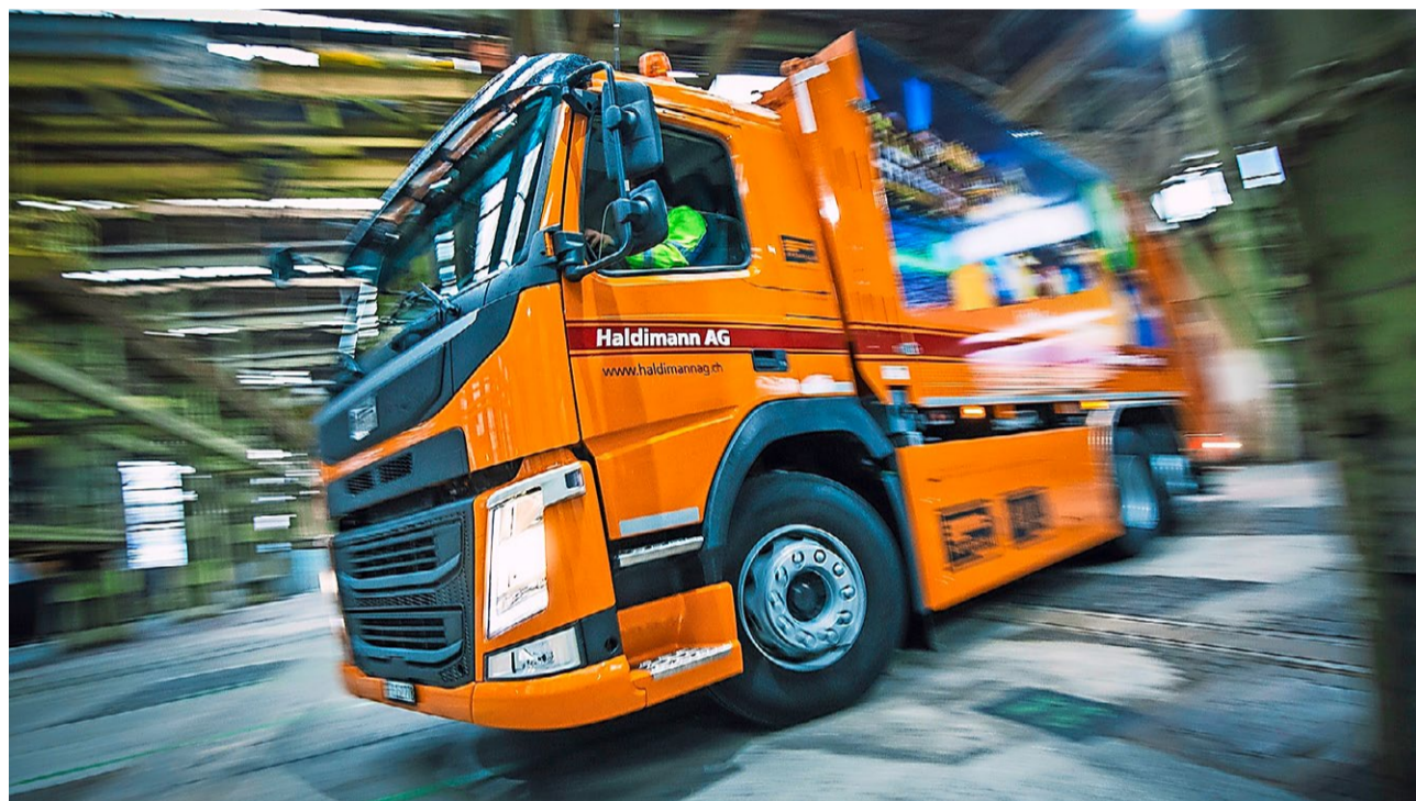
Der Climathon-Challenge «from a to b – emission free» entsprechend, jedoch bereits in die Realität umgesetzt: Die Winterthurer Müllentsorgung erfolgt teilweise per emissionslosem E-Lastwagen.